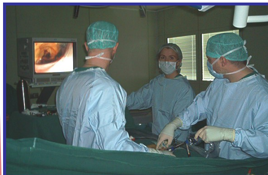
Aðgerð á nárakviðsliti á SHA 2003

Heilbrigðisstofnun Vesturlands Akranesi Sími 432 1000, fax 432 1001 www.hve.is